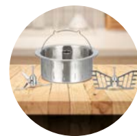
Akcesoria ze stali nierdzewnej