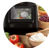
Wbudowana waga do 5 kg